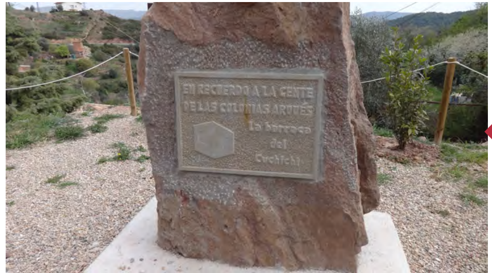
Vista exterior de les casetes de la Colònia Arquers. Monument commemoratiu a les persones mineres que van viure en aquestes casetes.