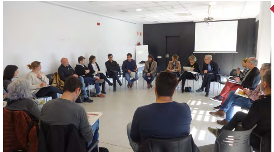
Trobada a Cardona. Presentacions entre els Ajuntaments, explicació de la cobertura de la visita i col·loqui de les diferents necessitats i problemàtiques en matèria d'habitatge.