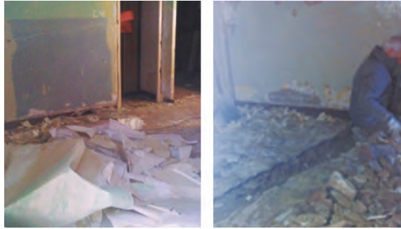
Imatges anteriors a les intervencions