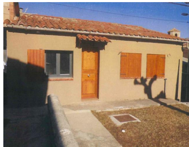
Imatge posterior a la intervenció