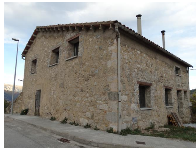
Imatge posterior a la intervenció