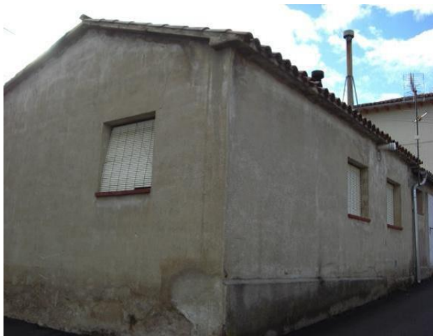
Imatge anterior a la intervenció