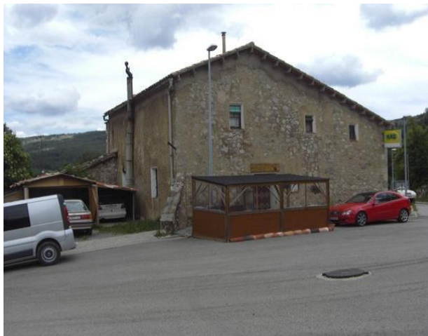
Imatge anterior a la intervenció